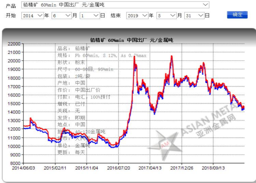
图 1 铅精矿（60%）中国出厂价格走势