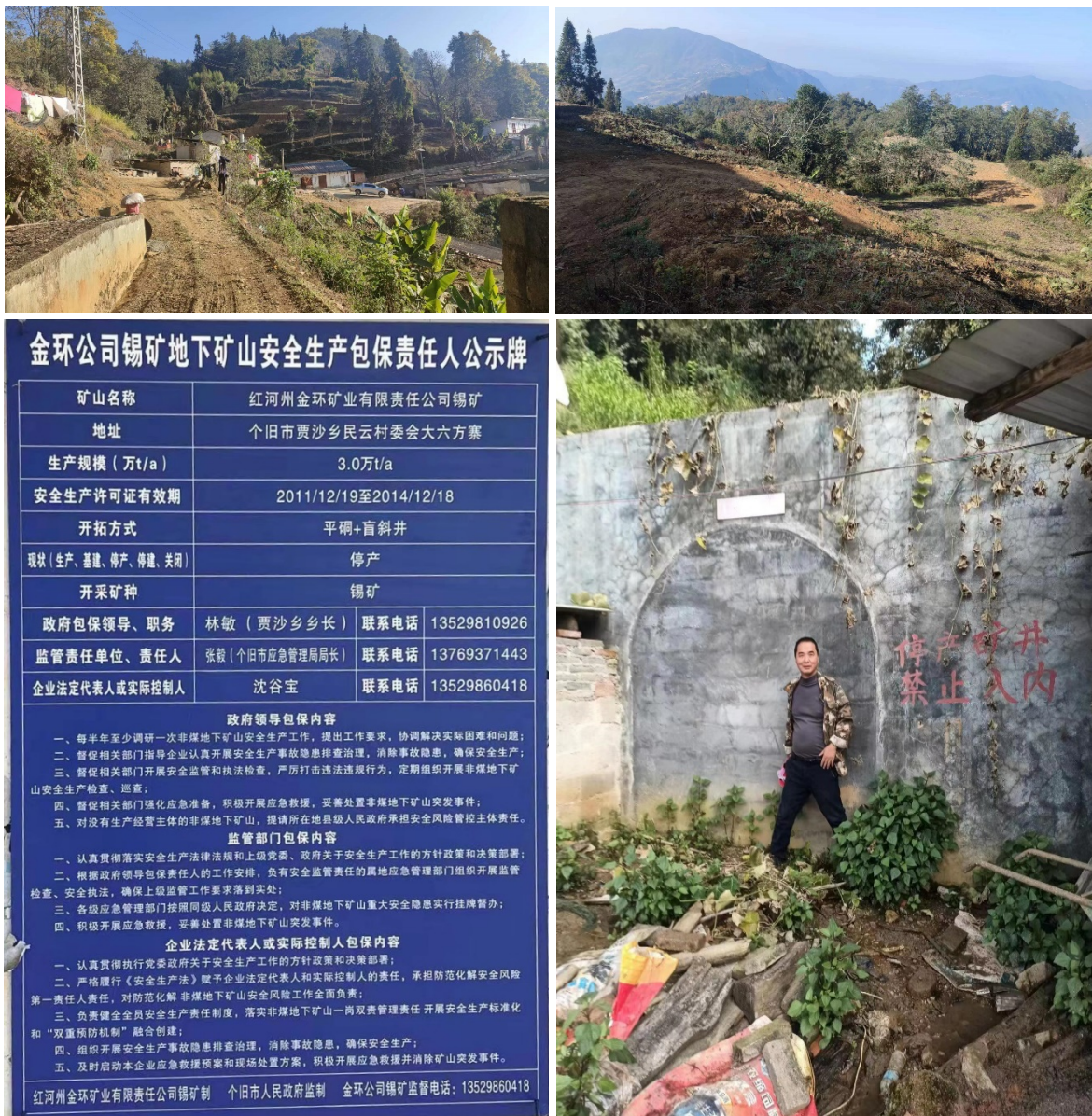
红河州金环矿业有限责任公司锡矿现场照片

2023年11月8日至11月10日，矿业权评估师左和军等评估人员对红河州金环矿业有限责任公司锡矿采矿权的地质资料、开采技术方案、矿产品的市场销售情况等进行了调查和核实，并收集了相关的资料。