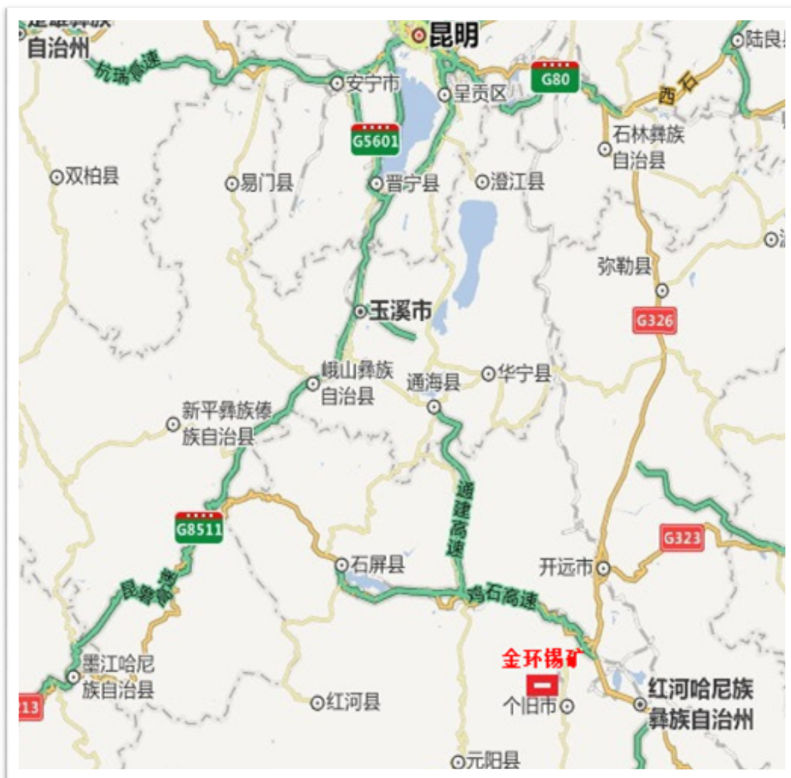
图 2 交通位置示意图

核实区及四周植被发育，森林覆盖率 67.5%。区内碳酸盐岩地层在地貌上容易形成起伏较大的陡崖和高山。